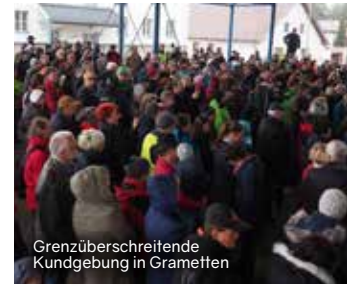
Grenzüberschreitende Kundgebung in Grametten

Grenzüberschreitende Energiekultur Gemeinsam mit den Menschen dies- und jenseits der Grenze zu Tschechien eine zukunftsfähige Energiekultur entwickeln!