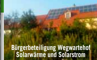
Bürgerbeteiligung Wegwarte Hof Solarwärme und Solarstrom